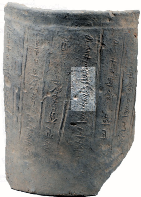
庚申四月三十日 惠陰寺造近學明